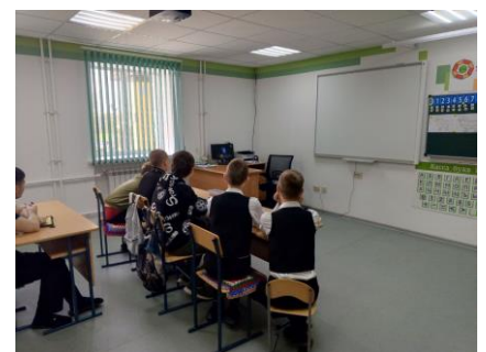
Просмотр видеоролика «Россия — моё будущее»

Подготовила: учитель 6 «В» класса Булыгина Г.Ф. 11.04.2024г.