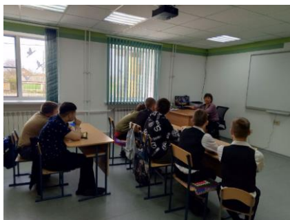
Просмотр видеоролика «Было-стало»

Просмотр видеоролика «Россия — моё будущее». Подведение итогов занятия.