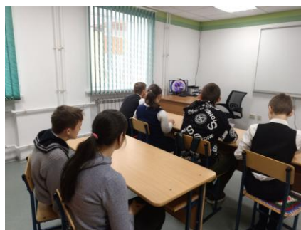
Просмотр видеоролика «Было-стало»