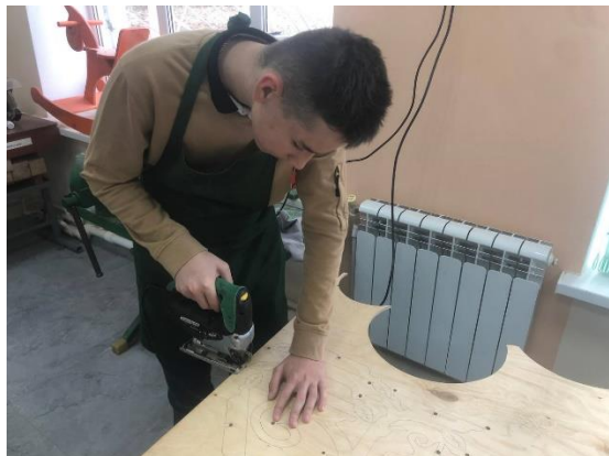
Работа с лобзиком