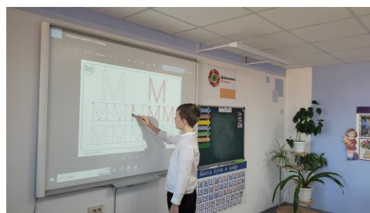
Письмо буквы Мм на уроке «Речь и альтернативная коммуникация»