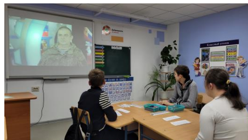
Просмотр видеоролика на уроке «Разговоры о важном»