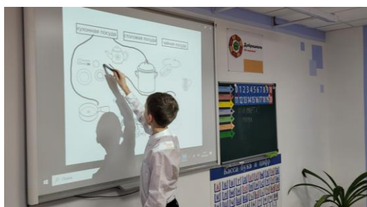
Сортировка посуды на уроке «Домоводство»