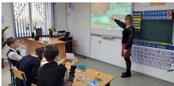
Презентация «Времена года» с использованием интерактивного оборудования в программе PowerPoint на уроке «Окружающий природный мир»