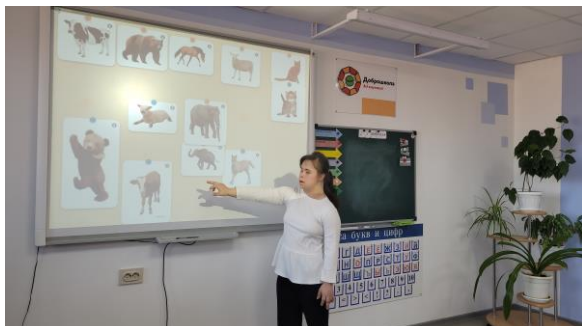
Нахождение животных и их детенышей на уроке «Окружающий природный мир»