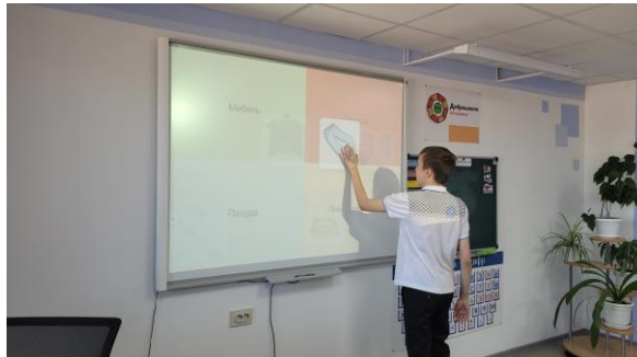
Сортировка предметов по группам на уроке «Окружающий социальный мир»

Использование интерактивной доски на уроках развивает интеллектуальные, творческие способности учащихся, мелкую моторику, способность ориентироваться в пространстве, содействует развитию коммуникативных аспектов навыков работы с учебной информацией и переноса её в практические навыки.