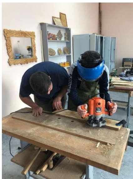
Практическая работа на уроке

Обработка кромок разделочной доски ручным электрофрезером