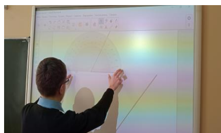
13.10.2023г. Урок геометрии 8 кл. Тема: Измерение острых углов с помощью транспортира