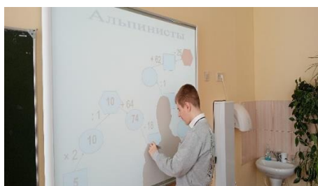
Устный счет с тренажером «Альпинисты»