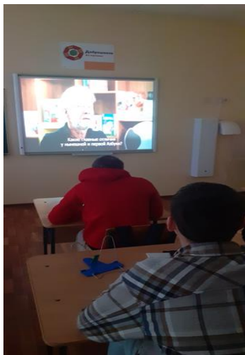
Просмотр видеофильма «Иван Федоров»

3. Заключительная. Подведение итогов занятия.