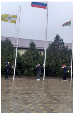
Церемония поднятия флага

В 8.20 - каждое утро понедельника в ОУ начинается с поднятия флага под гимн РФ. Затем проводится общешкольная беседа, согласно установленному циклу мероприятий. В своих учебных кабинетах обучающиеся продолжают вести «Разговор о важном» по теме согласно плана.