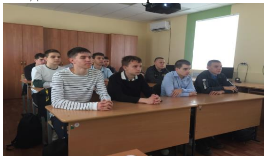
Беседа о вкладе великого русского поэта А.С. Пушкина в развитие русского языка

Поставленные цели и задачи занятия были реализованы.