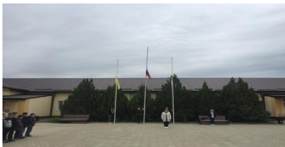
Церемония поднятия флага

В 8.20. - каждое утро понедельника в ОУ начинается с поднятия флага под гимн РФ. Затем проводится общешкольная беседа, согласно установленному циклу мероприятий. В своих учебных кабинетах обучающиеся продолжают вести «Разговор о важном» по теме согласно плана.