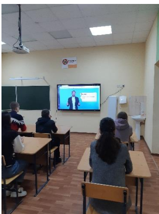
История налогов, видеоматериал

Часть 2. Основная. Знакомство школьников с видами налогов (налог на транспорт, имущество, земельный налог и НДФЛ), понятием ИНН, а также с некоторыми цифровыми сервисами налоговой службы (личный кабинет налогоплательщика). Для погружения в вопрос о значении налогов для государства учитель дал справку об истории налогов в России, ребята посмотрели небольшое видео.