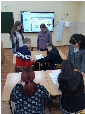
Выполнение заданий по группам

3. Заключительная. При подведении итогов занятия, ребята сделали выводы, что благодаря уплате налогов мы делаем вклад в общество и государство; появляются общественные блага, которыми мы все пользуемся, поэтому важно бережное отношение к тому, что нас окружает. Выделили главную мысль: каждый делает вклад в общее дело; налоги — инвестиции в будущее.