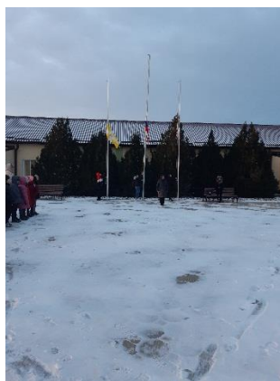
Церемония поднятия флага