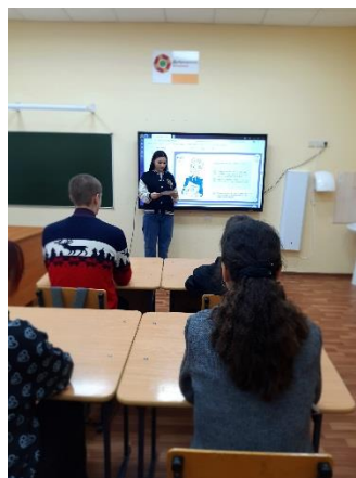
Подведение итогов. Налоги- инвестиции в будущее.