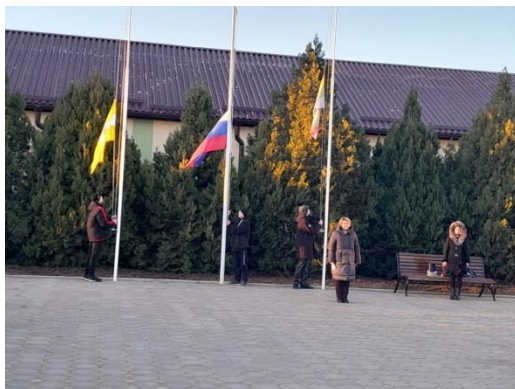
Церемония поднятия флага

В 8.20. - каждое утро понедельника в ОУ начинается с поднятия флага под гимн РФ. Затем проводится общешкольная беседа, согласно установленному циклу мероприятий. В своих учебных кабинетах обучающиеся продолжают вести «Разговор о важном» по теме согласно плана