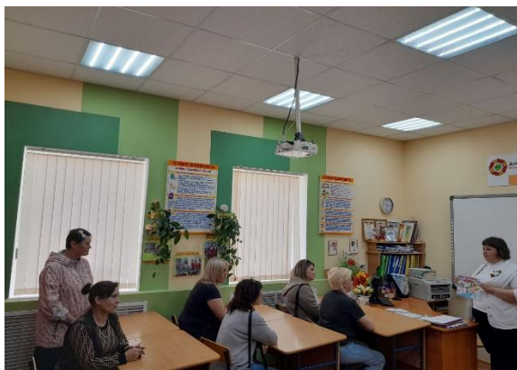
Работа с родителями