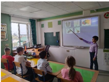
«Дом в котором мы живем» беседа о гигиене жилых помещений