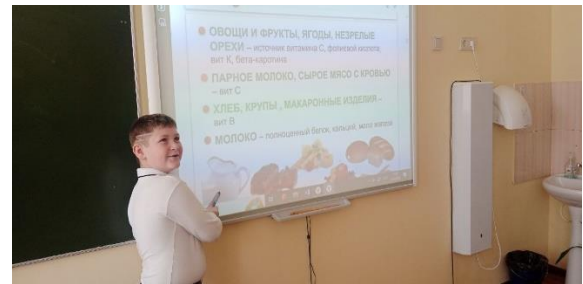
Работа с пословицами и поговорками

22.04.2024г.-24.04.2024г. Выпуск школьной газеты «Здоровые дети-наше будущее»