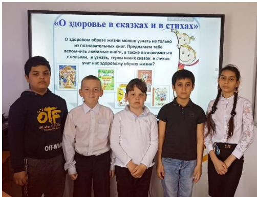
Чтение сказок о здоровом образе жизни