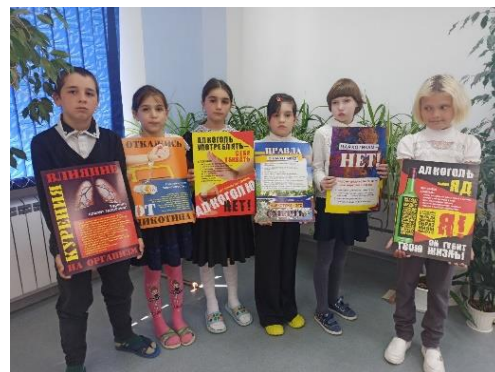
Урок здоровья: «Построим более справедливый, более здоровый мир»

22.04.2024г. -24.04.2024г. Лектории для родителей «Мы – здоровая семья»