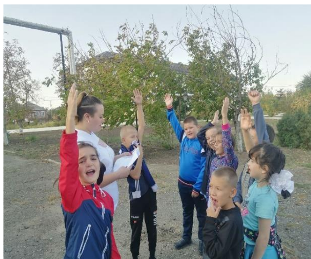
Эстафеты «Всемирный день здоровья»

08.04.2024г. Всемирный день здоровья «Мое здоровье, мое право»