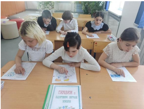
Чтение сказок о ЗОЖ

С 08.04.2024г по 12.04.2024г. – Проведены классные часы Ответственные: Классные руководители