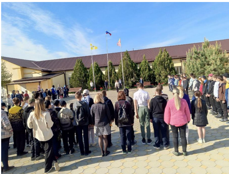
Линейка «Закрытие Месячника здоровья»

26.04.2024г. Линейка закрытия Месячника здоровья. Награждение активных участников.