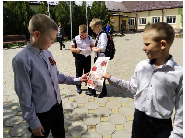
Выпуск школьных листовок «Здоровые дети-наше будущее»