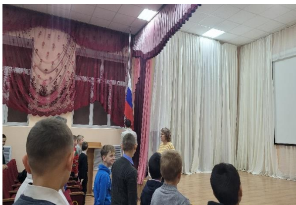
Церемония поднятия флага

В 8.20. – каждое утро понедельника в ОУ начинается с поднятия флага под гимн РФ. Затем проводится общешкольная беседа, согласно установленному циклу мероприятий. После чего все обучающиеся проходят по своим классам и продолжают работу по теме.