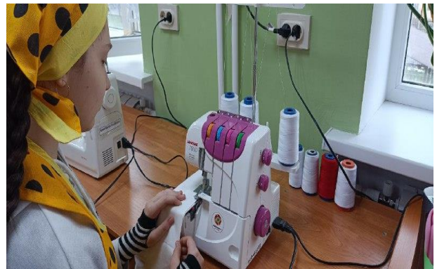
Обметывание шва соединения кокетки с основной деталью.