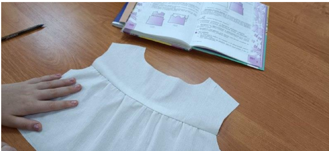
Завершение технологического процесса (узла) «обработка на образце прямой кокетки и соединение ее с основной деталью».