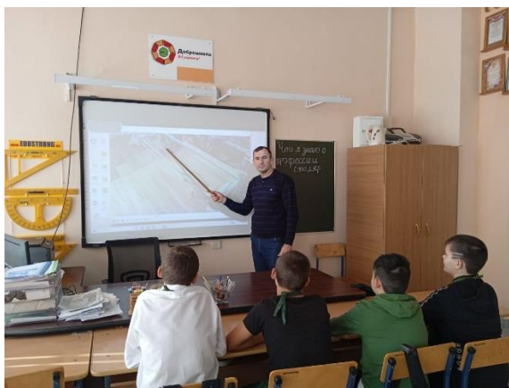
Работа у доски

В ходе урока педагог использовал интерактивные элементы: вопросы по теме урока, взаимодействие с обучающимися с опорой на имеющиеся знания и наблюдения.