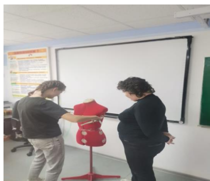
Конкурс: «Мода. Вкус и Красота»

С большим интересом обучающиеся принимали участие в конкурсах: «Мода. Вкус и Красота», «Есть такое изделие», «Мастер-конструктор», смотрели видеофильм о современных профессиях. Во время урока учащиеся так же решали практические задания по конкурсам. В конце урока учащиеся приколотили цветок на название той профессии, которую хотели бы выбрать.