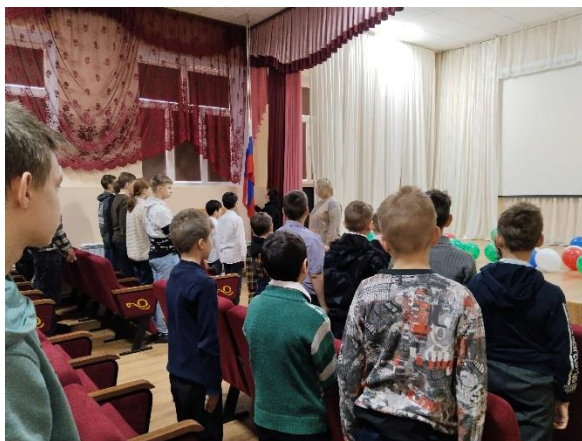
Церемония поднятия флага

В 8.20 - каждое утро понедельника в ОУ начинается с поднятия флага под гимн РФ. Затем проводится общешкольная беседа, согласно установленному циклу мероприятий. Затем все обучающиеся проходят по своим классам и продолжают работу по теме, согласно плана.