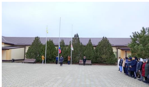
Церемония поднятия флага

В 8.20. - каждое утро понедельника в ОУ начинается с поднятия флага под гимн РФ. Затем проводится общешкольная беседа, согласно установленному циклу мероприятий. В своих учебных кабинетах обучающиеся продолжают вести «Разговор о важном» по теме согласно плана.