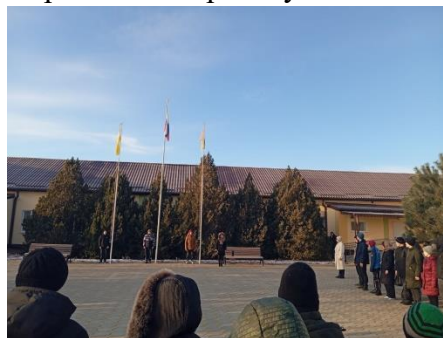
Церемония поднятия флага