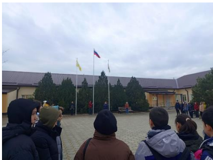
Церемония поднятия флага

В 8.20 – каждое утро понедельника в ОУ начинается с поднятия флага под гимн РФ. Затем проводится общешкольная беседа, согласно установленному циклу мероприятий. После чего все обучающиеся проходят по своим классам и продолжают работу по теме.